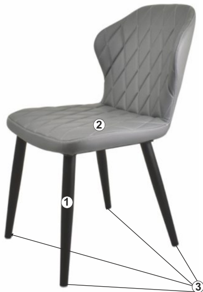
СХЕМА СБОРКИ СТУЛА «БЕРГАМО», Барный, П/Барный», «БЕРГАМО-ЭЙР», «БЕРГАМО-ЭЙР Барный, П/Барный», «БЕРГАМО-SKY», «БЕРГАМО-SKY Барный, П/Барный»,