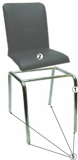
СХЕМА СБОРКИ СТУЛА «ДЖАЗ»