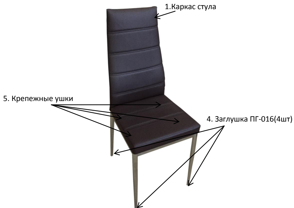
Схема сборки стульев : Норд В 970*Ш404*Г530